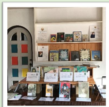
小淵沢 旧バウハウス