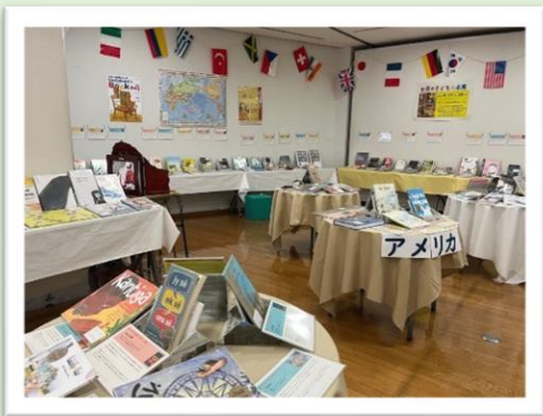
諫早市立諫早図書館