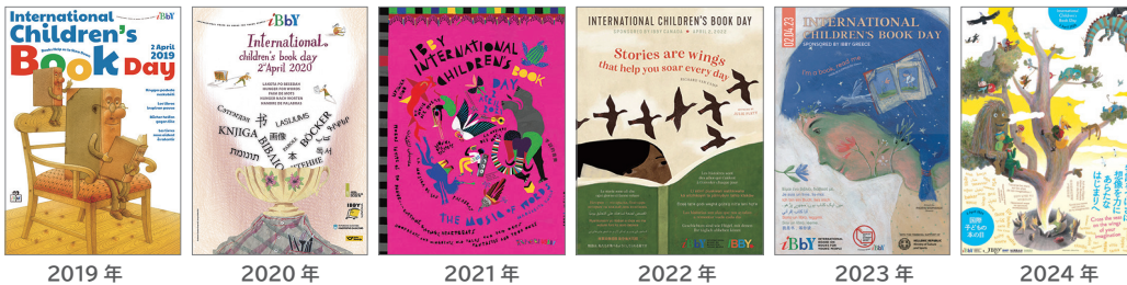
2019年 2020年 2021年 2022年 2023年 2024年