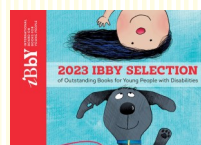
IBBY発行英文カタログ2023