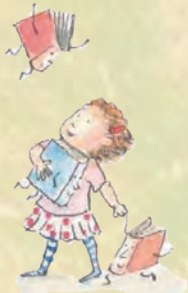
イラスト：児島なおみ