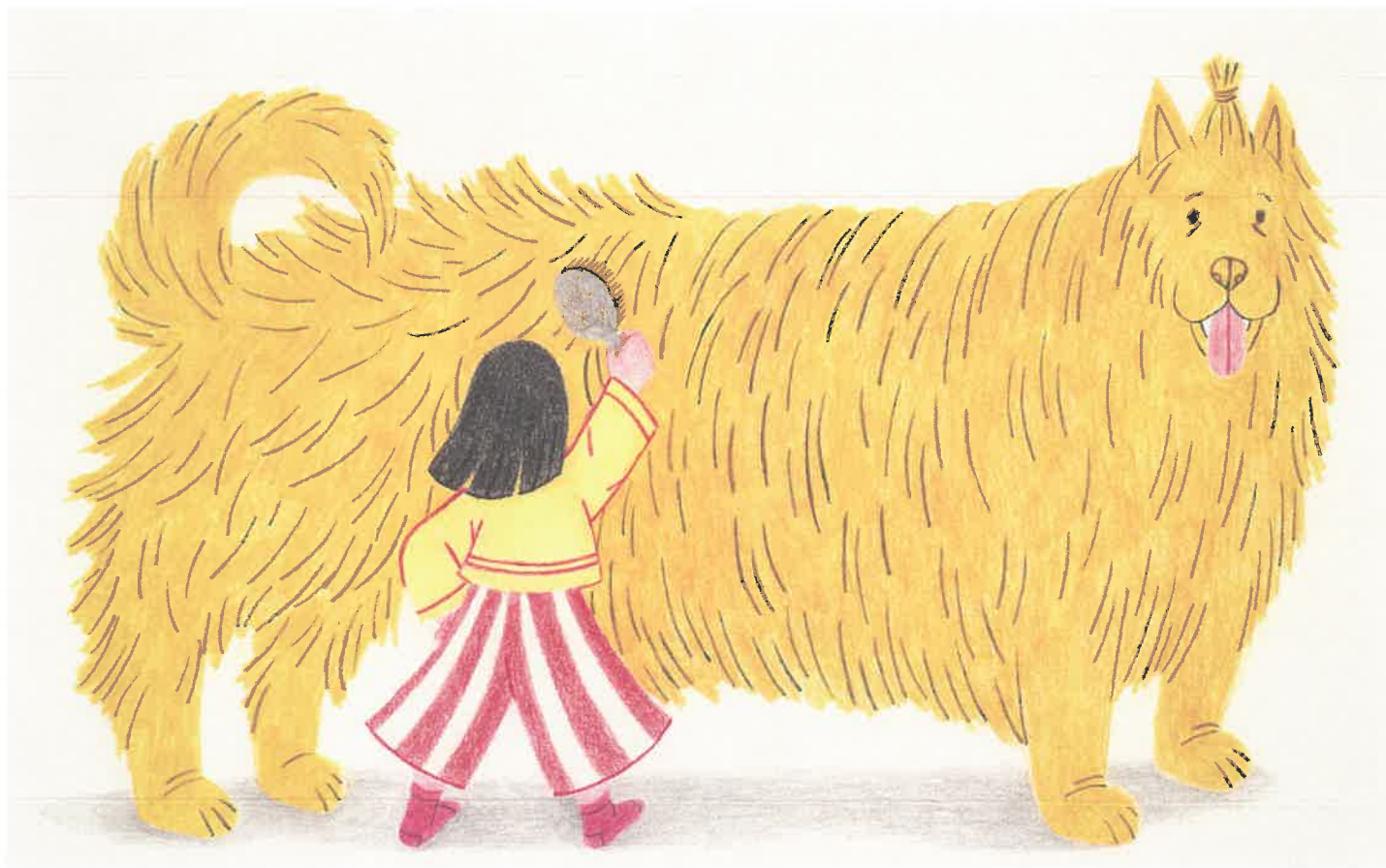
テレジア・フィロヴァー (スロヴァキア) 「ベノ」

~~~~~ Bologna Illustrators Exhibition ~~~~~